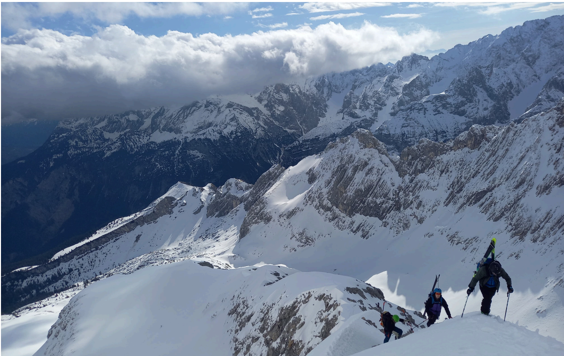
Jungmannschaft auf dem Ostgrat der Alpspitze - März 2024

Touren und Veranstaltungen Die Sektion sucht.. neue Pächter Soiernhaus aus dem Vorstand